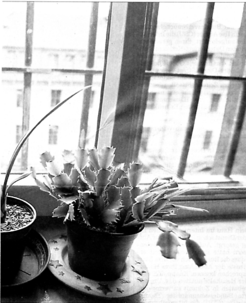
ingniss leben. Nun sind spezielle Hafthäuser für sie im Gespräch.

gleichsmaßstab für den Lebensstandard eines Sicherungsverwahrten erscheine „jenes Niveau gerechtfertigt, das für einen älteren Straftentlassenen realistisch wäre, der einer angelernten Tätigkeit nachgeht oder Hilfe zum Lebensunterhalt bezieht“.